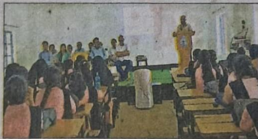
कार्यशाला को संबोधित करते अतिथि व विद्यार्थी।